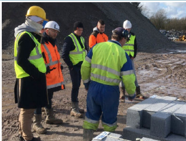
Visites et rencontres professionnelles