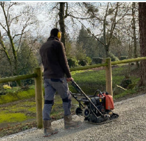
Conduite de chantier