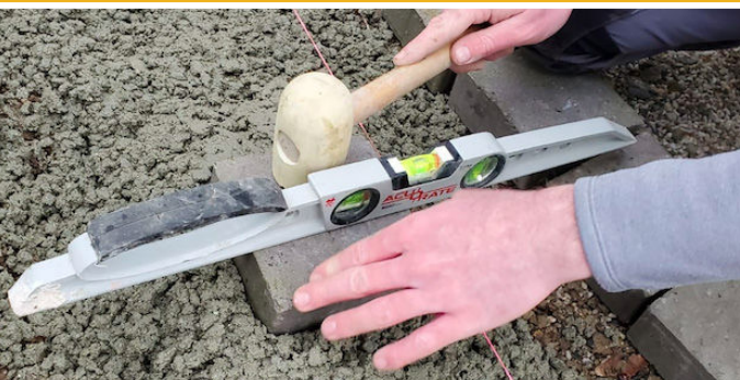
Utilisation d'outils et d'engins de chantier