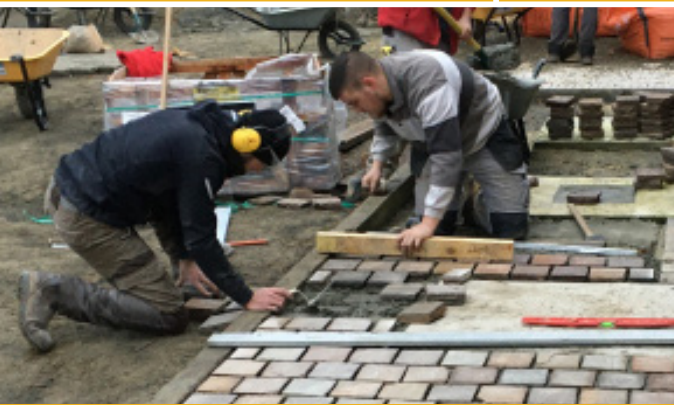
Réalisation de constructions paysagères